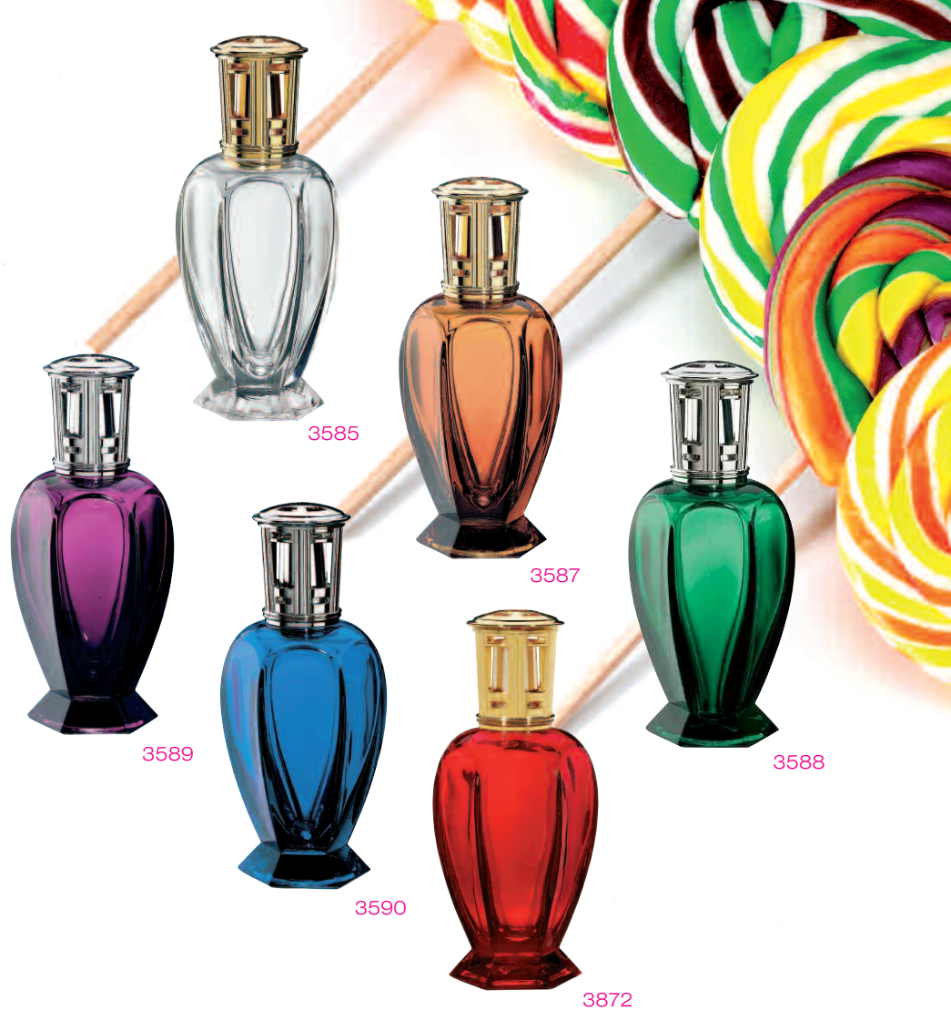
Athéna, Verre, Glass : 3585 Transparente. 3587 Ambre. 3588 Émeraude. 3589 Améthyste. 3590 Saphir. 3872 Rubis.